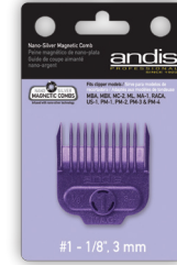
Item 66435 Single Small Comb

Comb size Tamaño de peine Grandeur des guide