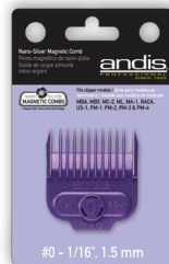
Item 66430 Single Small Comb

Comb size Tamaño de peine Grandeur des guide